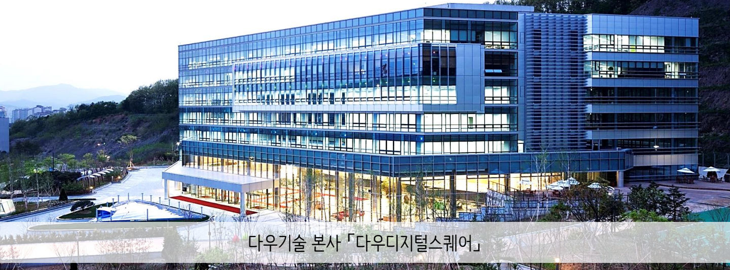
다우기술 본사 「다우디지털스퀘어」

다우기술은 30년 넘게 국내 IT산업을 이끌어 온 벤처 1세대 기업입니다. 세상에 많은 도움을 준다는 의미의 사명을 바탕으로 미래에도 고객의 변화와 혁신에 이바지하는 기업이 되겠습니다.